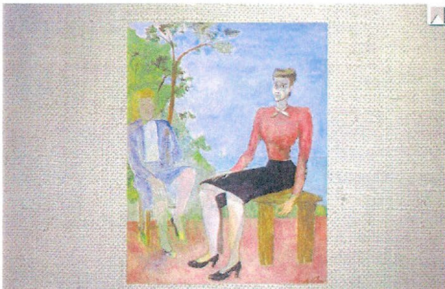
Número de referência: 1991 Início da década 40 115,0 x 88,0 cm Têmpera sobre tela Figuras/Retratos Frente - Canto inferior direito - A Volpi