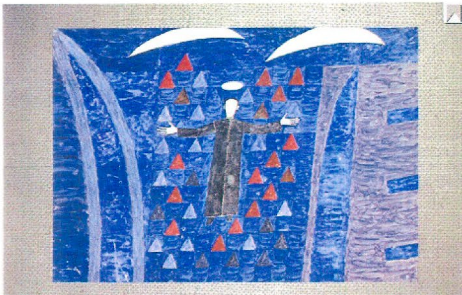
Número de referência: 1986 Meados da década 60 46,5 x 64,5 cm Têmpera sobre cartão Santos, madonas, temas religiosos e festas populares Frente - Canto inferior direito - A Volpi

“Parágrafo único – o COMODANTE se responsabiliza por quaisquer reclamos dos autores (ou eventuais sucessores) no que se refere às obras ora cedidas”, abaixo reproduzidas.